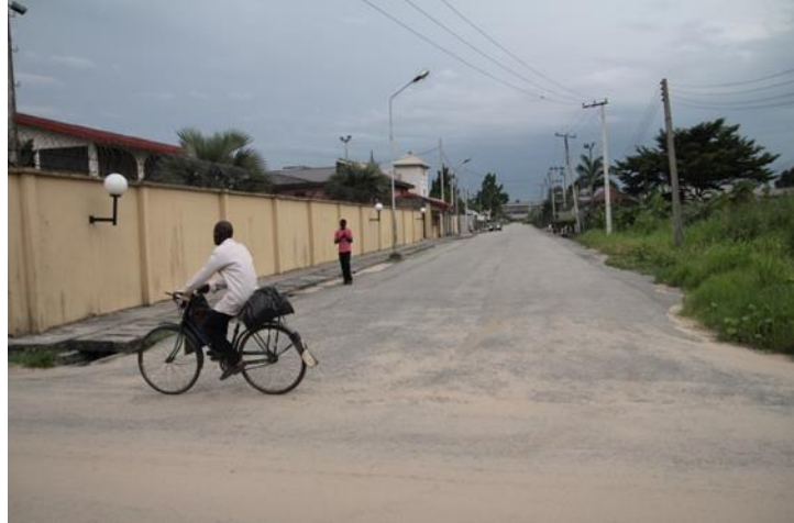
Rue d'Effurun, dans l'État du Delta, près d'où Moses Akatugba a été arrêté par l'armée nigériane le 27 novembre 2005.

L'avocat de Moses veut amener le jugement en appel puisqu'en plus des déclarations forcées présentées au procès, le policier responsable de l'enquête ne s'est pas présenté à l'audience et l'adolescent a donc été déclaré coupable sur la base du témoignage de la victime (qui selon l'avocat de Moses, était truffé d'incohérences).